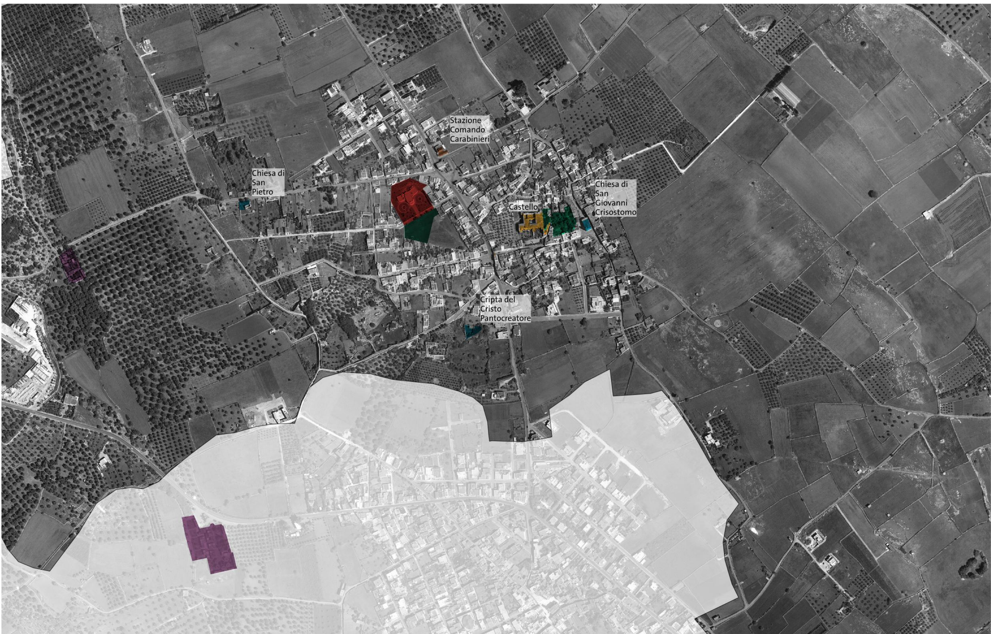
GIULIANO DI LECCE