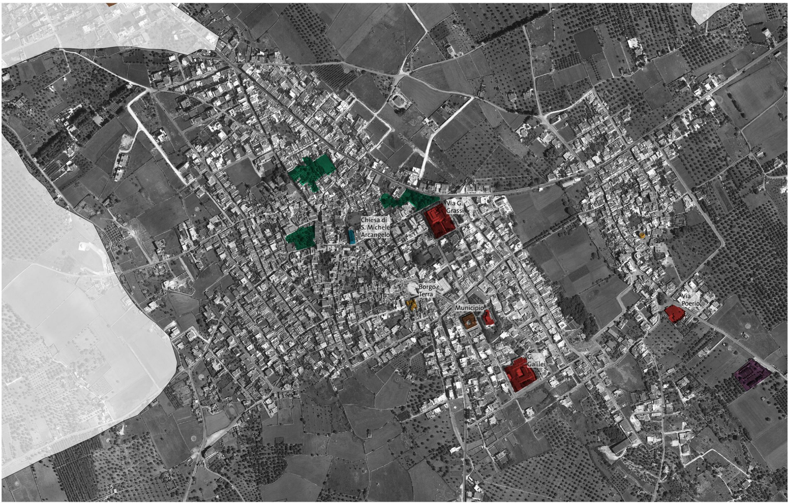
CASTRIGNANO DEL CAPO E SALIGNANO